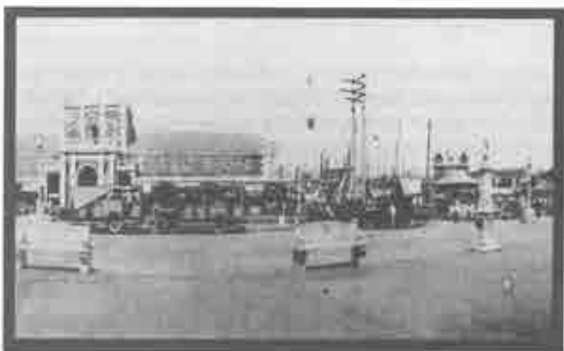
Buses estacionados frente al Muelle de los Pegasos y Mercado Público a mediados de siglo.