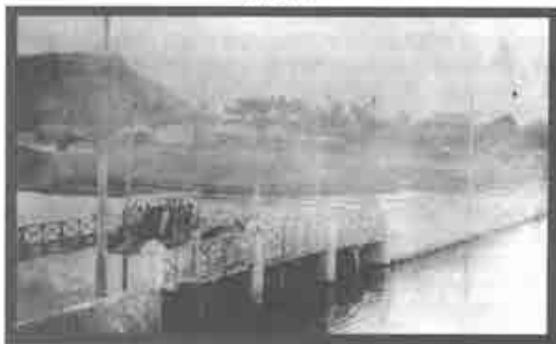
Bus con pasajeros cruza el puente que une los barrios de Getzmani y Manga, 1925.